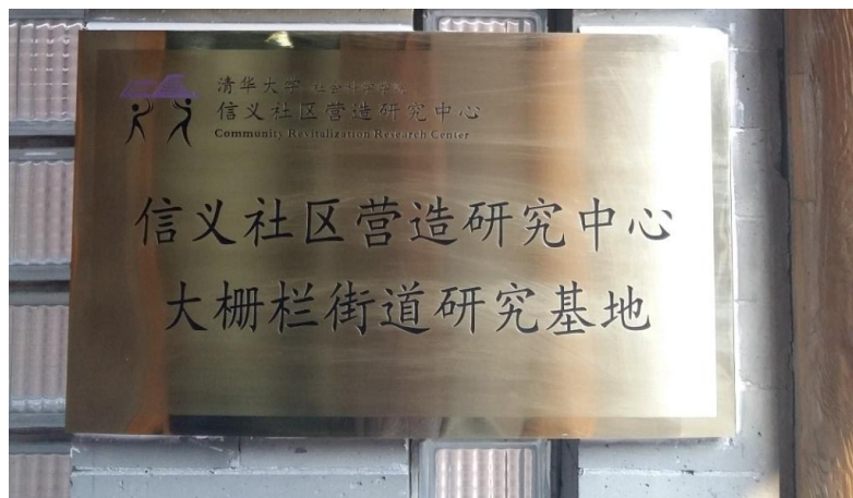
图 4：清华信义社营中心大栅栏研究基地铜牌

索和研究工作，并将社区营造理念不断进行宣传推广，积累更多本土实务案例，推广研究成果和实务工作经验。