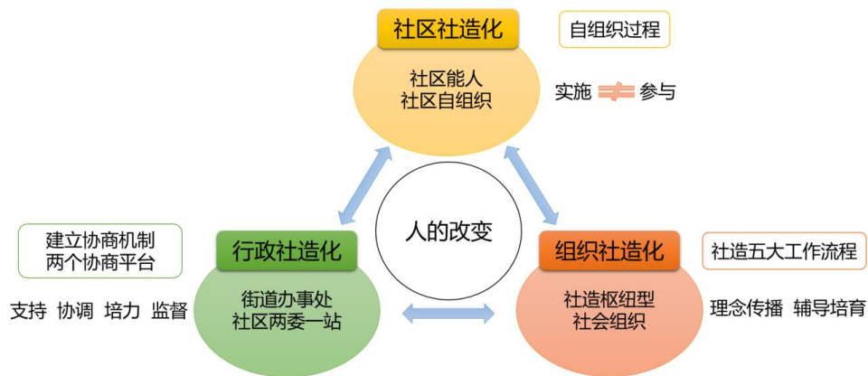
图：多元力量参与社区治理示意图

2018 年合作的重点工作将进行第三届微公益创投及组织培育工作，为社区社会组织提供多维度陪伴及培力辅导。