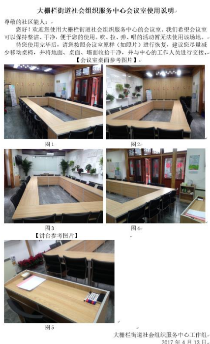
图 5：基地会议室使用说明

清华社造团队一直驻扎在此基地，除了日常的办公以外，每个月都会为社区自组织举办一次报销会，同时通过各种渠道发布通知邀请社区自组织伙伴来基地办公和举办会议，并制作了会议室使用说明。