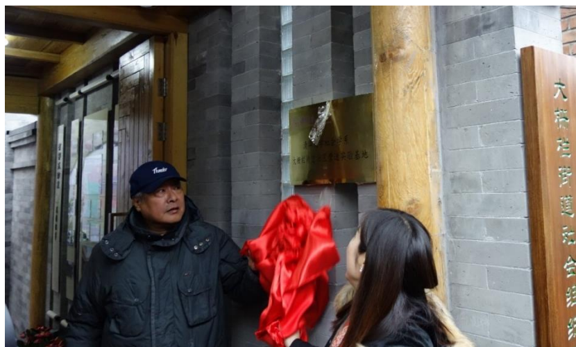
图 1：2017 年 3 月 24 日大栅栏街道及清华团队共同揭牌

2017 年 3 月 24 日，经过清华信义中心和街道办事处为期一个月的筹划，大栅栏街道社区社会组织孵化基地（又名“有邻苑”）终于正式揭牌。当天上午来自北京市社工委、西城区民政和社工委的领导以及街道书记主任、社会办科长、社区书记主任、社区能人等近 30 人参加了启动仪式。